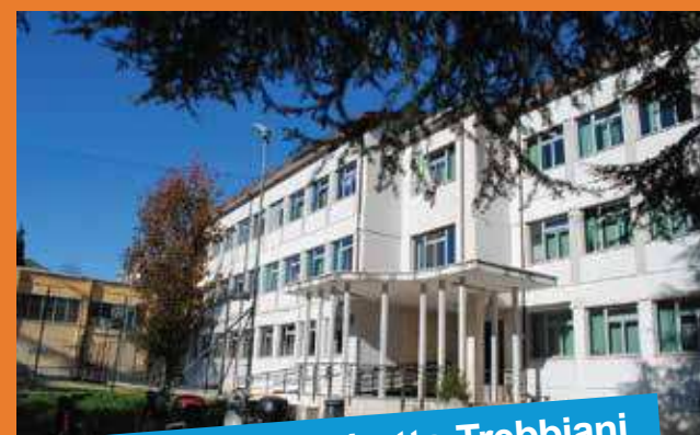
Liceo Elisabetta Trebbiani

Il nostro istituto dispone di una rete interna con la possibilità di accesso aperta a tutti gli studenti mediante una specifica password. La dotazione digitale consente ai docenti di sperimentare pratiche didattiche innovative basate sull'utilizzo delle nuove tecnologie, come la Flipped Classroom. La metodologia dell'insegnamento capovolto propone l'inversione dei due momenti classici, lezione e studio individuale: la lezione viene prevalentemente spostata a casa, sostituita dallo studio individuale dei materiali suggeriti dall'insegnante; lo studio individuale viene spostato a scuola, e prevede un'attività preferibilmente collaborativa, dove l'insegnante può esercitare il suo ruolo di tutor al fianco degli studenti.